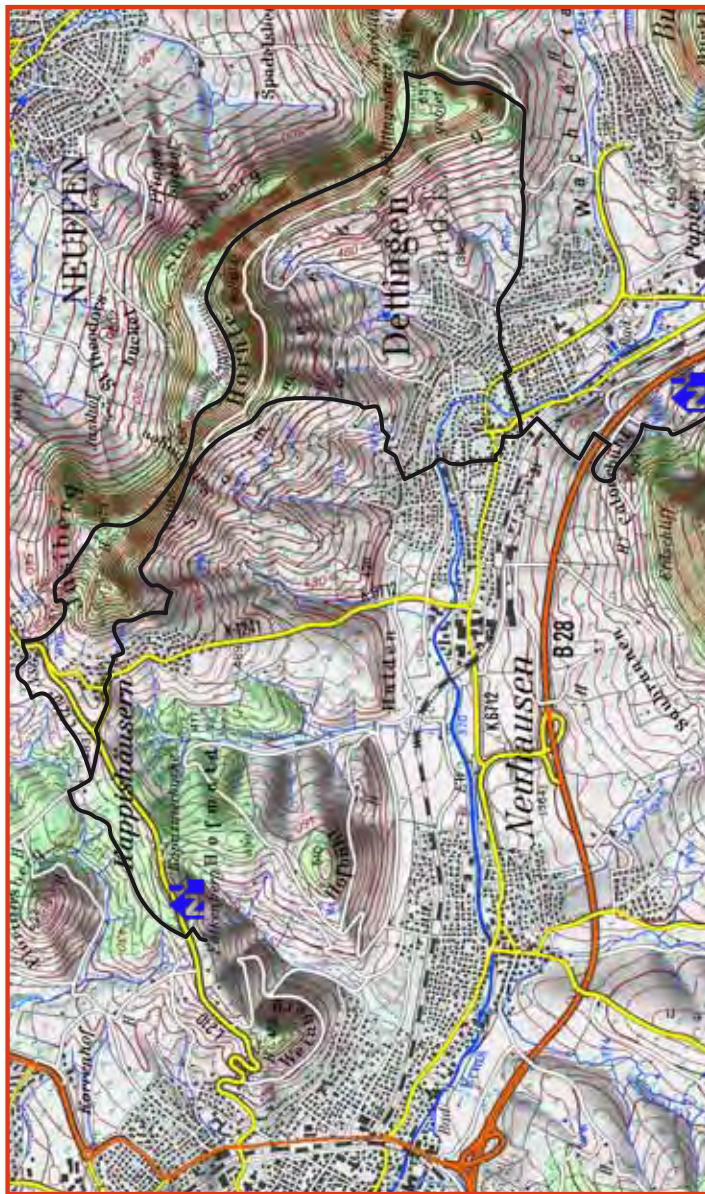
Grundlage: Topografische Karte 1:50000 -, vom 22.01.2009, Az: 2851.2-D/6866