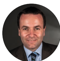
Manfred Weber Spitzenkandidat von EVP, CDU und CSU sowie Vorsit- zender der EVP-Fraktion im Europäischen Parlament

Ausschüsse des Europäischen Parlaments haben grundsätzlich kein Vetorecht. Wir wollen bestehende Institutionen wie die Europäische Umweltagentur, die gute Arbeit leisten, stärken. Außerdem fördern wir Grünen, den Haushalt der EU an übergeordneten nachhaltigen Politikzielen wie dem Pariser Klimaabkommen auszurichten. Das bedeutet, dass Haushaltslinien anhand fest definierter Nachhaltigkeitskriterien darauf geprüft werden, ob sie einen Beitrag dazu leisten, diese Ziele zu erreichen.