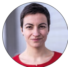
Ska Keller EU-Abgeordnete der Grünen und Spitzenkandidatin zur Europawahl

Warum tut sich die EU so schwer mit einer sozial-ökologischen Transformation?