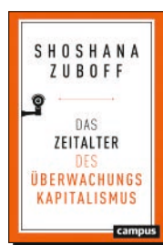
Shoshana Zuboff: Das Zeitalter des Überwachungs-Kapitalismus. Campus, Frankfurt am Main/New York 2018, 727 Seiten, ISBN 978-3-593-50930-3

„Smart City“ als Konzept wird durch Unternehmen der IT-Branche propagiert, mit vielen Versprechungen. Das Buch stellt die Urbanisierung digitaler Technologien, die Digitalisierung in Städten und die Globalisierung von Smart-City-Visionen vor und diskutiert sie. Dabei spielen die Tendenzen zur unternehmerischen Stadt eine wesentliche Rolle. Zugleich kommen mögliche alternative Nutzungen digitaler Technologien in Städten und die Rolle zivilgesellschaftlicher Akteure zur Sprache. Die Ambivalenzen der technologisch getriebenen Modernisierung von Städten mit ihrem Versprechen von mehr Sicherheit und besseren Orientierungsmöglichkeiten, mit zunehmender Kontrolle, Überwachung, Steuerung und Normierung ziehen sich durch das Buch. Unterschiedliche Darstellungsformen – etwa ein Beitrag in Form von „walk & talk“ in Hamburg – bereiten Lesevergnügen. Technologische Entwicklungen der digitalen Transformation werden vorgestellt und kritisch im Kontext von Vorstellungen von Stadt, Urbanität, Demokratie und Beteiligung diskutiert.