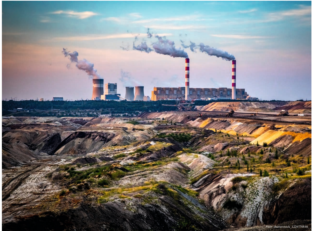
Braunkohleabbau und Kraftwerk im polnischen Bełchatów: Selbst die USA haben niedrigere Grenzwerte als die EU für Kohleemissionen.

Die Begründung: Die EU definiere gar keine unverrückbaren Grenzwerte, sondern lasse den Mitgliedsstaaten einen