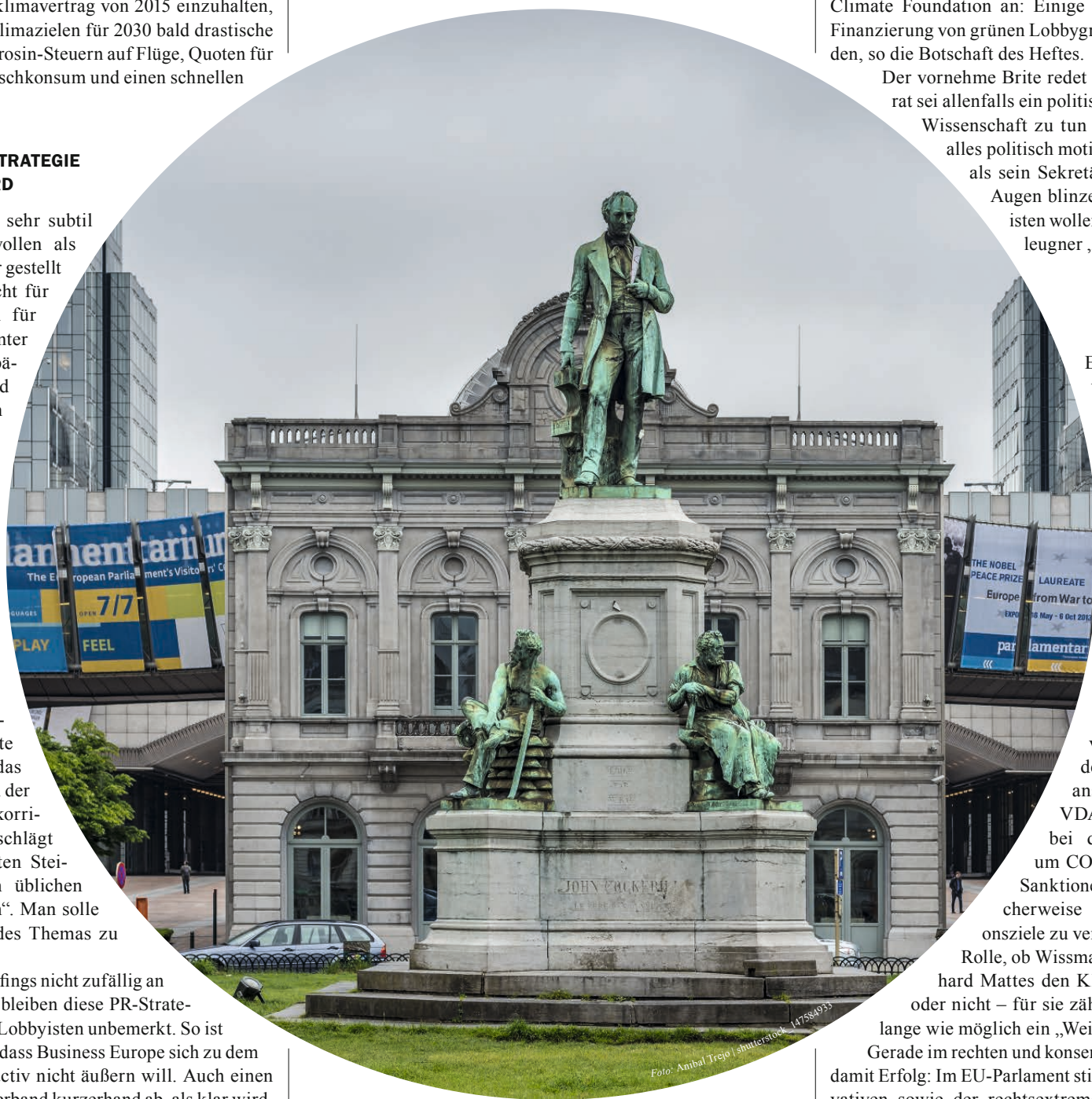
Bis zu 30.000 Lobbyisten belagern das EU-Parlament – rund um den Place du Luxembourg in Brüssel wird in Büros, Cafés und Restaurants Politik gemacht.

Die Recherche wurde finanziell durch ein Stipendium der Otto-Brenner-Stiftung und den europäischen Journalismusfonds IJ4EU unterstützt.