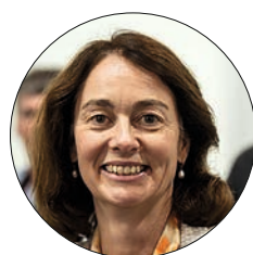
Katarina Barley Spitzenkandidatin der SPD für die Europawahl

Erlauben Sie mir, in der Grundannahme zu widersprechen: Das Europäische Parlament ist bereits die Umweltinstitution schlechthin in der EU. Von der EU-Chemikalienverordnung REACH über die Kreislaufwirtschaft bis zum Verbot von Wegwerfplastik: Ohne das Europäische Parlament als starker und selbstbewusster Ko-Gesetzgeber wären wir heute beim Umweltschutz längst nicht so weit in Europa. Anstatt neue Strukturen und Vetospieler zu schaffen, sollten wir deshalb die bestehende europäische Umweltinstitution stärken und Europas Demokratie voranbringen. Das Europäische Parlament braucht endlich ein Initiativrecht, damit es die Gesetze, die es später beschließt, auch selbst einbringen kann. Um diesem Ziel schnell Rechnung zu tragen, werde ich mich als Kommissionspräsident dazu verpflichten, legislative Vorschläge aus dem Parlament in die Gesetzgebung zu bringen.